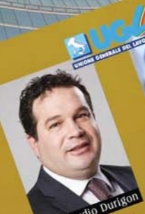
On. Claudio Durigon